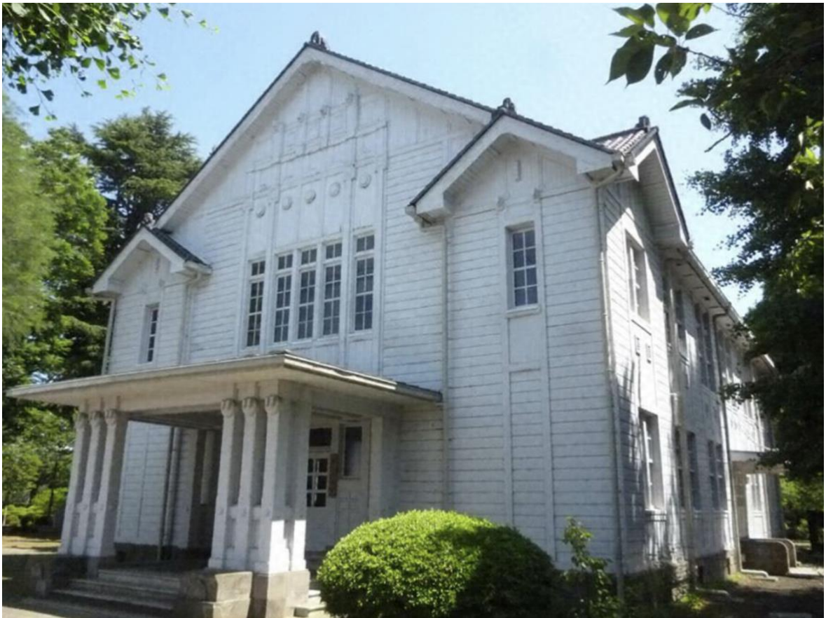
（宇都宮大学 峰ヶ丘講堂）